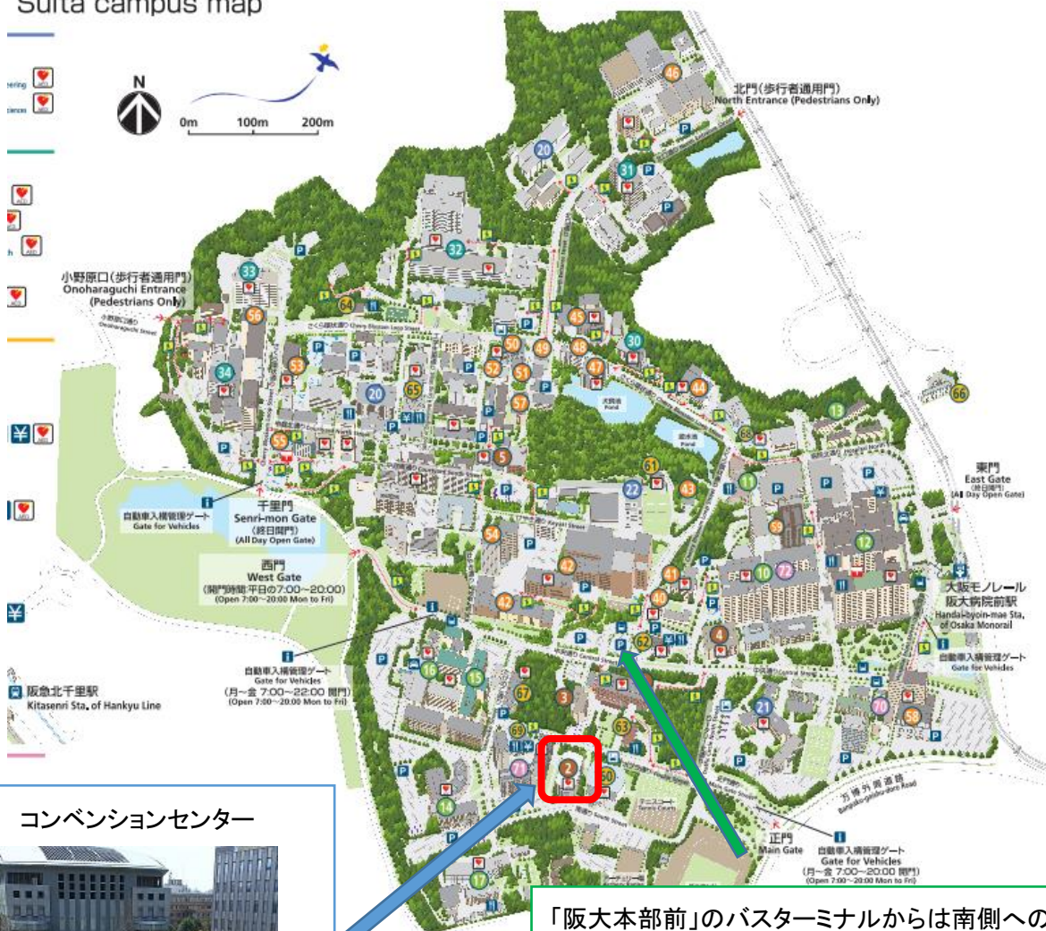
コンベンションセンター