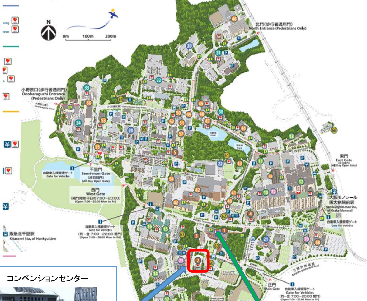
コンベンションセンター