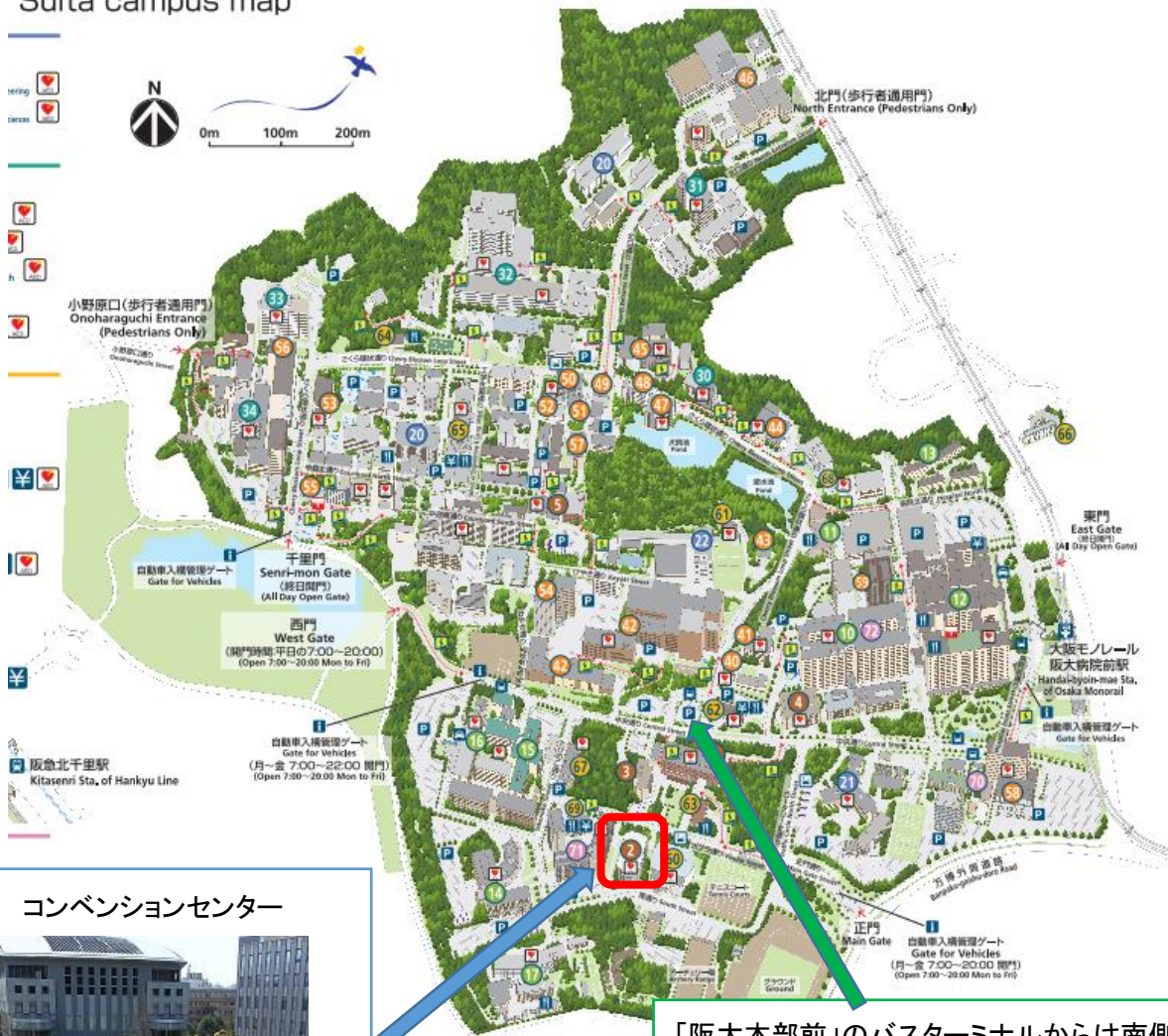
コンベンションセンター